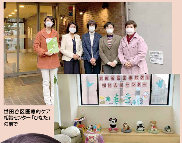
世田谷区医療的ケア相談センター「ひなた」の前で

世田谷区では、医療的ケア相談センターを設置し、さまざまな相談への対応を行うとともに、在宅生活を支える計画や災害時個別の支援計画などの作成も行っています。今後は、保育園や学校へ通うお子さんを支援するためにも保健、医療、福祉、教育等の連携を一層推進していく必要があります。